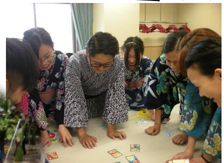
ちいきのイベント

「お母さん」と地域のイベントに参加して、日本の文化を教えてもらって良かったです。いろいろな国の留学生とも会って、新しい友だちもできました。（ベトナム/専門学校生）