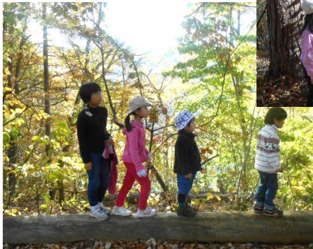
キャンプ場散策に出発!

* 食事(初日夕食から最終日昼食) +プログラム費+傷害保険+光熱費を含む * 3歳未満のきょうだいの宿泊はご相談ください。