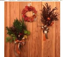
オリジナルクラフト作り